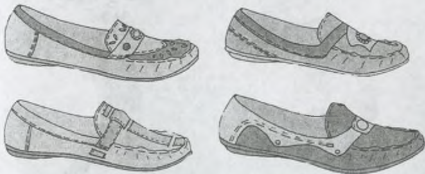
Рисунок 2 Эскизы традиционных конструкций мокасин

Большое значение в оформлении имеет способ соединения овальной вставки с союзкой: торцевой шов, с окантовкой и обтачкой. Главная особенность конструкции мокасин состоит в том, что заготовка с союзкой из целого кроя закрывает носочно-пучковую часть следа колодки и переходит на боковую часть колодки до места соединения с овальной вставкой. Были разработаны современные традиционные конструкции мокасин, которые представлены на рисунке 2.