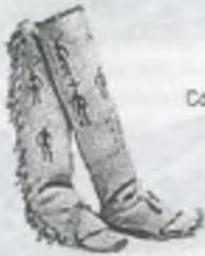
Men's boots with beaded effigies of mountain spirits, Apache, late 19th century