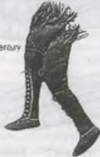
Рисунок 1 Исторические аналоги мокасин

Исторические исследования являются ценнейшим источником для создания новых моделей. Никакая обувь не заменит нам мокасины. Они универсальны.