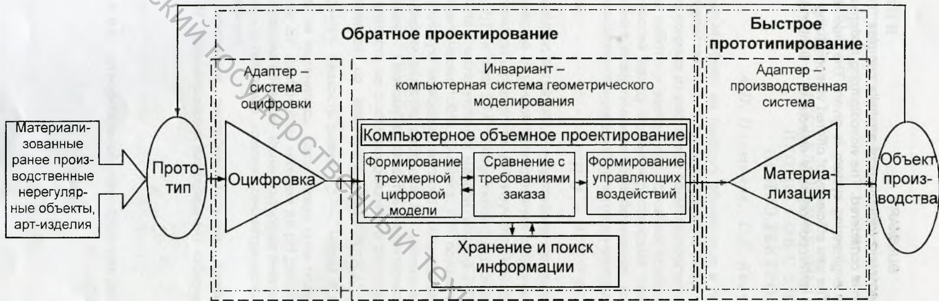
Рисунок. 1 – Схема процесса рекурсивного формообразования нерегулярных поверхностей