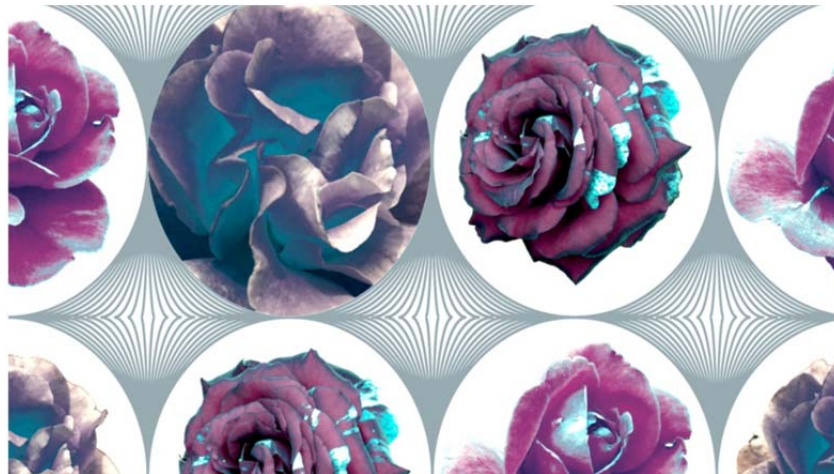
Рисунок 3 – Рисунок из студенческой коллекции принтов для льняных тканей, выполненной для РУПТП «Оршанский льнокомбинат» с использованием растровой графики

Современная модная иллюстрация сочетает в себе реалистичность фотографии и графические изображения, выполненные в разных техниках рисунка и живописи. Такие эскизы выглядят как реалистичные и имитируют фотографию, создавая стильный имидж презентации новых образов. При создании принта с эффектами живописности лучше воспользоваться программой Adobe Photoshop. Затем, по необходимости, после создания основного мотива раппорт можно составить в векторном редакторе. Владея разнообразными приемами, дизайнер может представить ту или иную концепцию коллекции эскизов тканей, растиражировать ее, получить бесконечное множество вариантов.