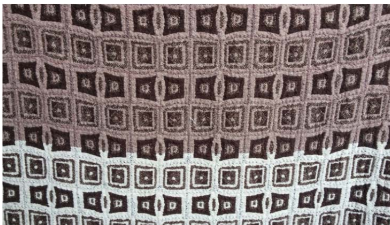
Рисунок 1 – Жаккардовая ткань, выполненная для РУПТП «Оршанский льнокомбинат» с использованием векторной графики при разработке эскиза

При создании жаккардовой ткани из простых четких элементов с простым раппортом целесообразней применять векторную графику (рис. 1).