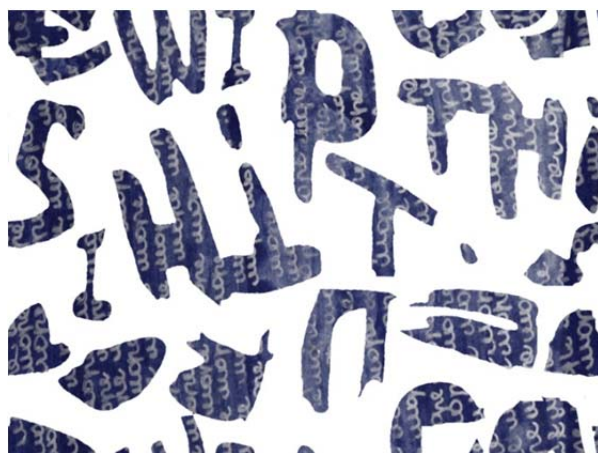
Рисунок 2 – Рисунок из студенческой коллекции принтов для льняных тканей, выполненной для РУПТП «Оршанский льнокомбинат» с использованием векторной графики

Элементы орнамента легче и быстрее нарисовать при помощи основных инструментов рисования, используя опорные точки и соединяющие линии. В тех областях, где принципиальное значение имеют ясные и четкие контуры, например, в создании тканей с использованием шрифтовых композиций векторные программы незаменимы (рис. 2).