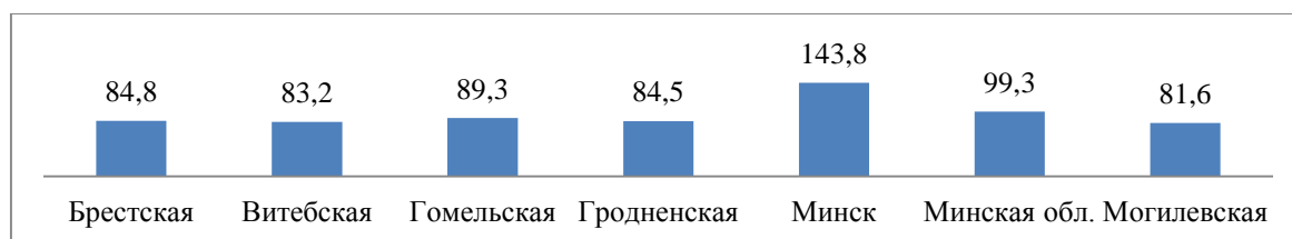
Рисунок 1 – Номинальная начисленная среднемесячная заработная плата, в % к республиканскому уровню (1 квартал 2019 г.)

В основе регионального фактора лежит различный уровень развития регионов, не связанный с экологическими проблемами. Он проявляется в различном объеме ВРП. Отсюда и разный уровень доходов жителей областей республики (рис. 1).