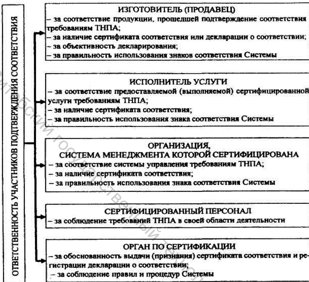
Рисунок 1 – Распределение ответственности между участниками подтверждения соответствия

Совет по подтверждению соответствия Национальной системы подтверждения соответствия Республики Беларусь – коллегиальный совещательный орган, формируемый для обеспечения оценки функционирования, мониторинга реализации целей и выработки рекомендаций по вопросам развития Национальной системы подтверждения соответствия Республики Беларусь.