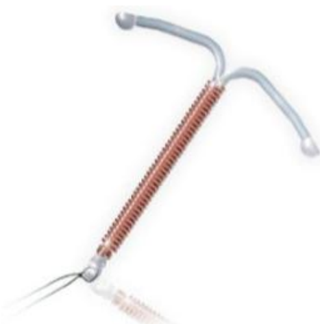
Рисунок 1 – Вид внутриматочной спирали «Юнона Био-Т»

Экспериментальное исследование прочностных характеристик разработанной ВМС проводили на специальной установке позволяющей фиксировать ответное усилие со стороны спирали при горизонтальном сжатии. Установлено, что при горизонтальном сжатии ВМС ответное усилие действующее со стороны спирали в начале (при смещении вдоль горизонтальной оси на 0,5 мм) резко возрастает до 0,32 Н, при дальнейшем сжатии контрацептива, ответное усилие снижается до 0,28 Н и остается на данном уровне при сжатии вплоть до 3 мм (рис.2).