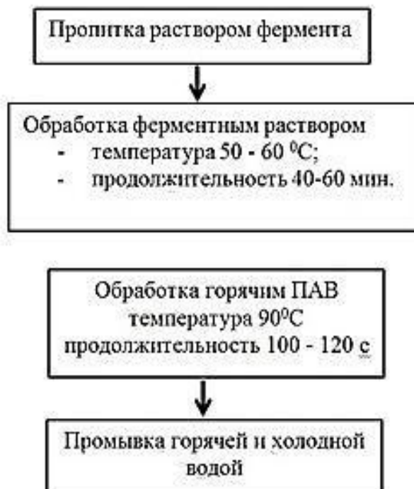
Рисунок 1 – Технологическая схема биообработки льняных тканей