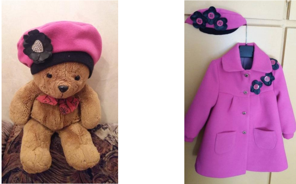
Рисунок 2 – Изделия с элементами отделки из натуральной кожи

Рациональным использованием межлекальных выпадов также могут служить аппликации из остатков натуральной кожи. На рисунке 3 представлены предлагаемые образцы аппликаций для детских пальто из отходов натуральной кожи.