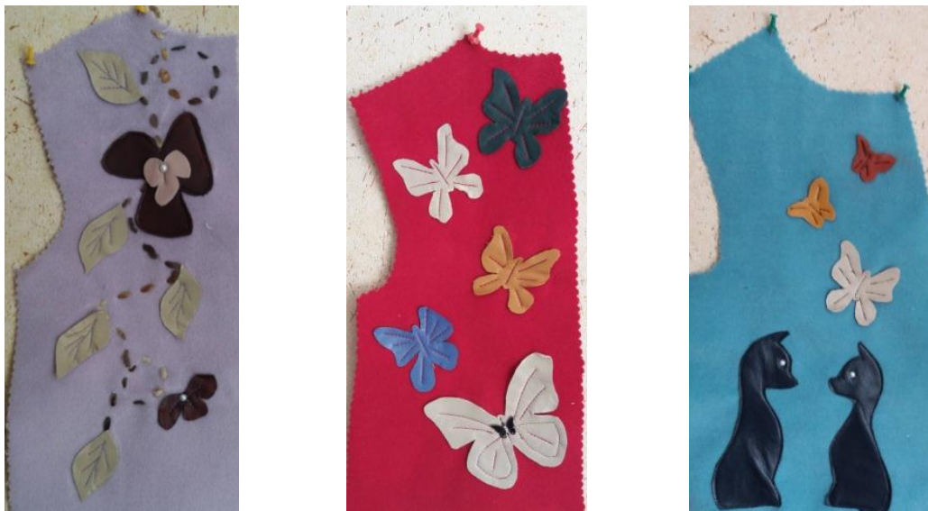
Рисунок 3 – Аппликации из отходов натуральной кожи

Рациональным использованием межлекальных выпадов также могут служить аппликации из остатков натуральной кожи. На рисунке 3 представлены предлагаемые образцы аппликаций для детских пальто из отходов натуральной кожи.