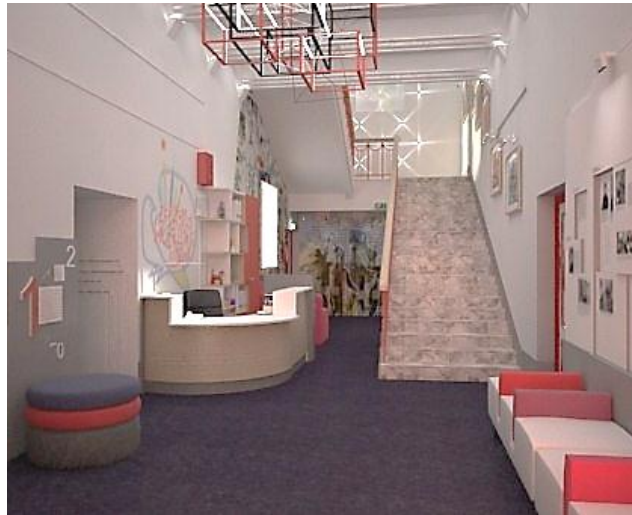
Рисунок 2 – Холл первого этажа