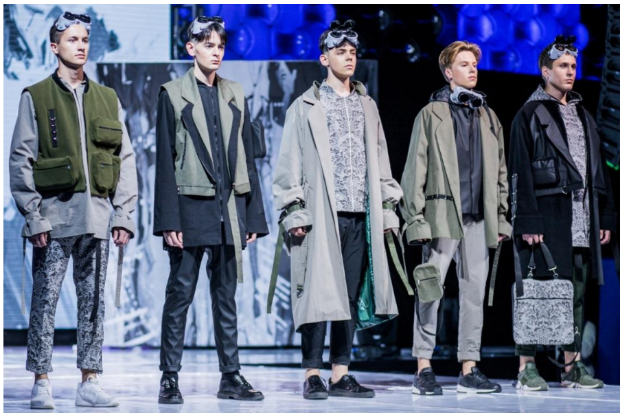
Рисунок 2 – Демонстрация авторской коллекции на конкурсе «Мельница моды 2018»